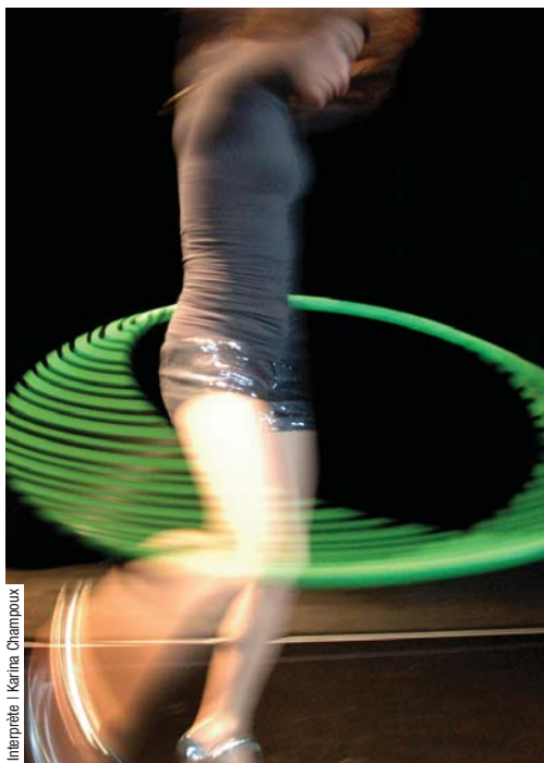
Interprète | Karina Champoux

au Centre Pierre-Péladeau les 14, 15, 16 janvier 2010